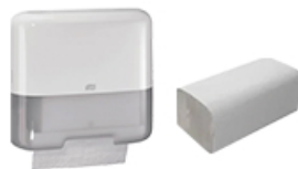
ArtNr.: 99 Spender & Handtuchpapier 2-lagig 3000 & 4000 Stk. / Ktn.