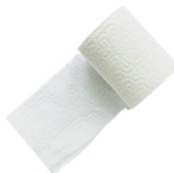
ArtNr.: 101 Toilettenpapier weiß | 2-lagig, 3-lagig 24 Roller / Ktn.