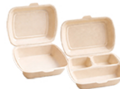
ArtNr.: 47 Menübox (IP4) champagne, 1/2 / 3-Fach 200 Stk. / Ktn.