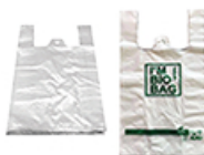
ArtNr.: 50 Hemdchentragetasche 45 cm, 48 cm, 55 cm rot, grün, orange & Bio (grün/weiß) 2000 Stk. / Ktn.