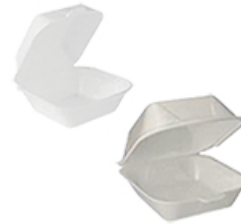
ArtNr.: 45 Burgerbox weiß IP6 groß, IP7 klein 500 Stk. / Ktn.