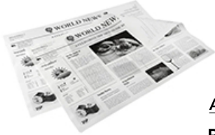
ArtNr.: 34 Pergamentersatz weiß, 1/4, 1/8 Bogen 40g/m 2 braun, 1/4 Bogen 42g/m 2