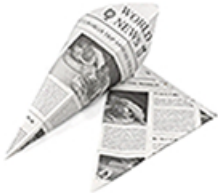
ArtNr.: 36 Spitztüte "Newspaper" Gr.: 19 cm 1000 Stk. / Ktn.