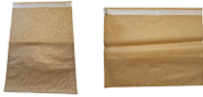
ArtNr.: 32 Dürüm & Hamburger-Papier m. Kleberstreifen 38x30 cm / 25x35 cm 1000 Stk. / Ktn.