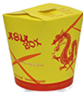
ArtNr.: 13 Asia-Box - 26 oz gelb m. China-Motiv 500 Stk./Ktn.