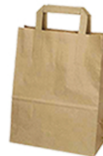
ArtNr.: 49 Papiertragetaschen, kraft - 26 × 17 × 29,5 cm - 31 × 18 × 31,5 cm - 33 × 20 × 33 cm 250 Stk. / Ktn.