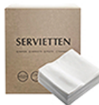
ArtNr.: 48 Servietten – Weiß 1-lagig, 1/4 Falz, 33x33cm 4 kg, 2000 Stk. / Ktn.