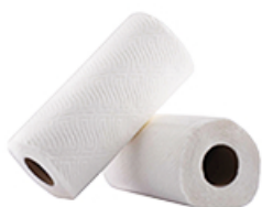
ArtNr.: 102 Küchenroller 8 & 12 / Ktn.