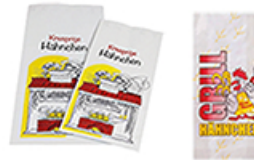
ArtNr.: 37 Hähnchenbeutel, Alu-kaschiert / Pergament 1/1 (ganzes Hähnchen) 1/2 (halbes Hähnchen) 1000 Stk. / Ktn.