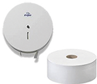
ArtNr.: 100 Spender & Toilettenpapier Jumbo 6 x Roller / Ktn.