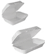
ArtNr.: 46 Lunchbox IP9 klein, IP10 groß weiß, 1-Fach 500 Stk. / Ktn.