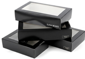
ArtNr.: 12 Sushibox m. Fenster In versch. Größen