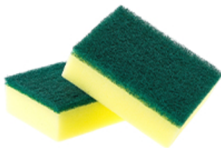
ArtNr.: 114 Padschwamm mit Griff, 3 Größen