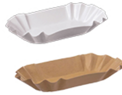
ArtNr.: 41 Pommesschale 500, 750, 1000 ml 250 Stk. / Ktn.