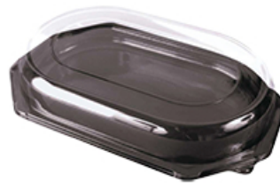
ArtNr.: 16 Menüplatte m. Deckel, schwarz Größe: M, L, XI