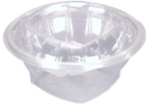
ArtNr.: 42 Salatschale Klappbox 500, 750, 1000 ml 300 Stk. / Ktn.