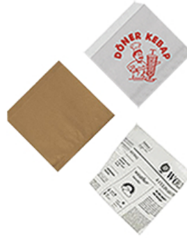
ArtNr.: 33 Dönertüte weiß / Kraft / Wallpaper 11,5 x 11,5 x 9 cm 1000 Stk. / Ktn.