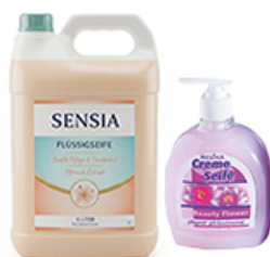
ArtNr.: 105 Flüssigeseife - Kanister, 5 L - Pumpflasche