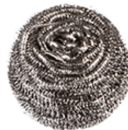
ArtNr.: 115 Metalltopfreiniger

Qualität, auf die Sie sich verlassen können