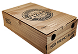
ArtNr.: 21 Pizzakarton Calzone 16 x 30 x 10 cm 100 Stk. / Ktn.