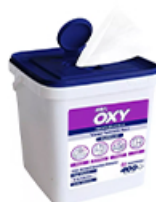
ArtNr.: 103 Allzweckreinigungstücher extra stark 400 Stk. / Dose