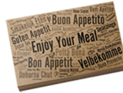
ArtNr.: 35 Einschlagpapier, fettgedichtetes Papier 30x40cm, braun "Enjoy" 1000 Stk. / Ktn.