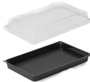
ArtNr.: 14 Sushischalen m. Deckel, eckig schwarz, S / M / L / XL / XXL 100 Stk. / Pkg., 6 Pkg / Ktn.