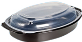
ArtNr.: 17 Mikrowellen-geeignete Schale In versch. Größen und Formen 140 Stk. / Ktn.