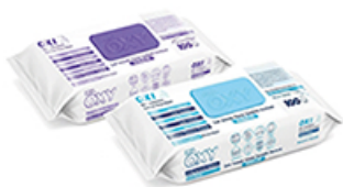
ArtNr.: 104 Allzweckreinigungstücher mit Duft 100 Stk. / Pkg.