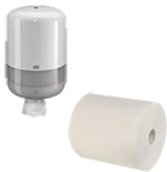
ArtNr.: 98 Spender & Handtuchroller 6 Roller / Ktn.