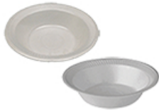
ArtNr.: 44 Salatschale B2 klein, B3 groß weiß 11,5 x 11,5 x 9 cm 600 Stk. / Ktn.