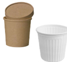
ArtNr.: 18 Suppenbecher To-Go 16 oz & 26 oz kraft-braun & bagasse 500 Stk./Ktn.