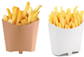
ArtNr.: 40 Pommes-Schütte braun & weiß 85ml, 196 ml