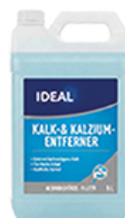
ArtNr.: 107 Kalk-Rostlöser, 5L