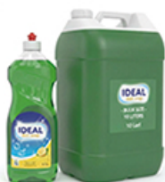
ArtNr.: 106 Spüllmittel, 1 & 10 L Kanister