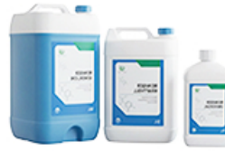
ArtNr.: 109 Allzwecksreiniger 1 L / 5 L / 10 L