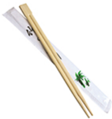
ArtNr.: 15 Stäbschen, Bambus 210 mm, 100 Stk. / Pkg.