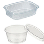
ArtNr.: 43 Dressingbecher von 25 bis 1000 gr. rund, oval, eckig 250, 500 Stk. / Ktn.