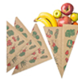
ArtNr.: 39 Spitztüte braun m. Früchte-Motiv In versch. Größen 1000 Stk. / Ktn.