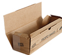
ArtNr.: 20 Pizzakarton Rollo 28 x 8 x 7 cm 100 Stk. / Ktn.