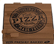
ArtNr.: 19 Pizzaboxen, in versch. Größen & Motive 100 Stk. / Ktn.